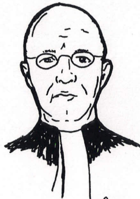
en een rechter en een dominee